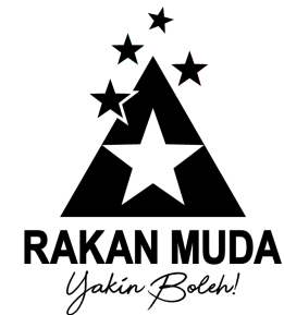
Hitam & Putih