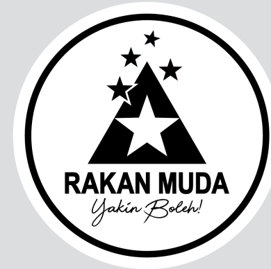
Hitam & Putih

*Hanya untuk latar belakang putih sahaja